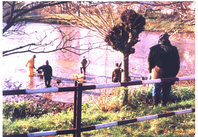
Výlov rybníka na návsi

devatenácté bylo veliké svými vynálezy, bouřlivé svými vojny, rušné svými převraty politickými a národnostními spory – století dvacáté, pevně doufáme, bude ve všem století pokroku, zastíní svého předchůdce a oblaží lidstvo. Dále doufáme, že hrozné války pomínou.“ Takový optimistický byl náhled na nadcházející století, a jak to dopadlo, můžete posoudit sami. Vždyť téměř celé století se válčilo a boje neutichají ani dnes. Jeden plamínek se stěží podaří uhasit, jinde vypuká další požár. Proto doufejme, že přání, které vyslovili lidé před sto lety, se podaří splnit ve století jedenadvacátém. -zj-