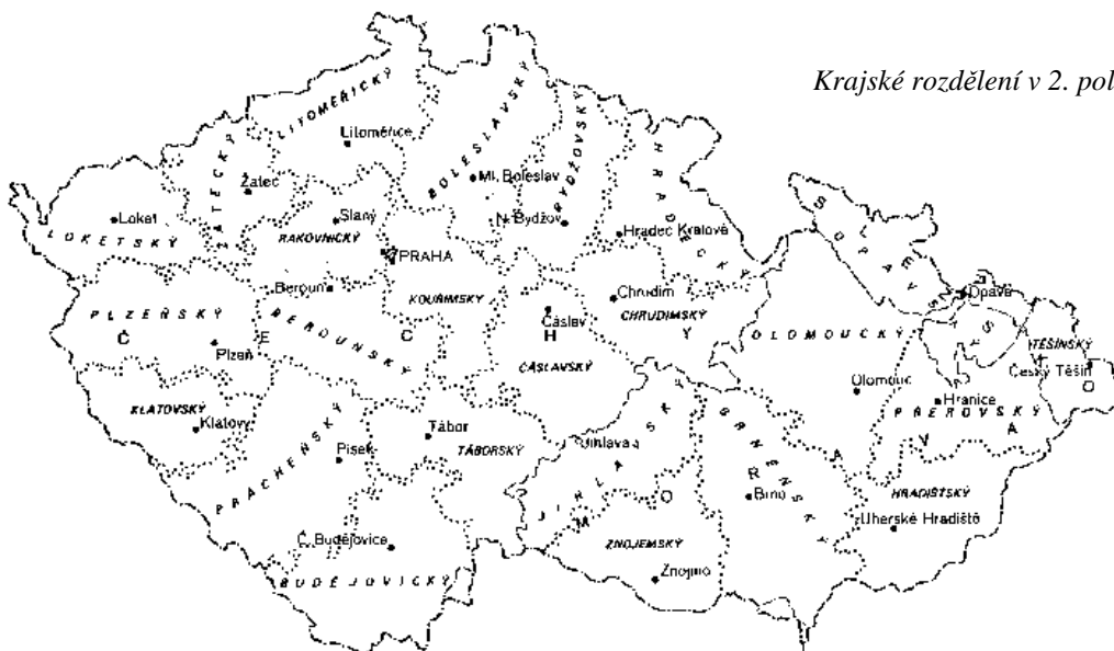
Krajské rozdělení v 2. polovině 18. století