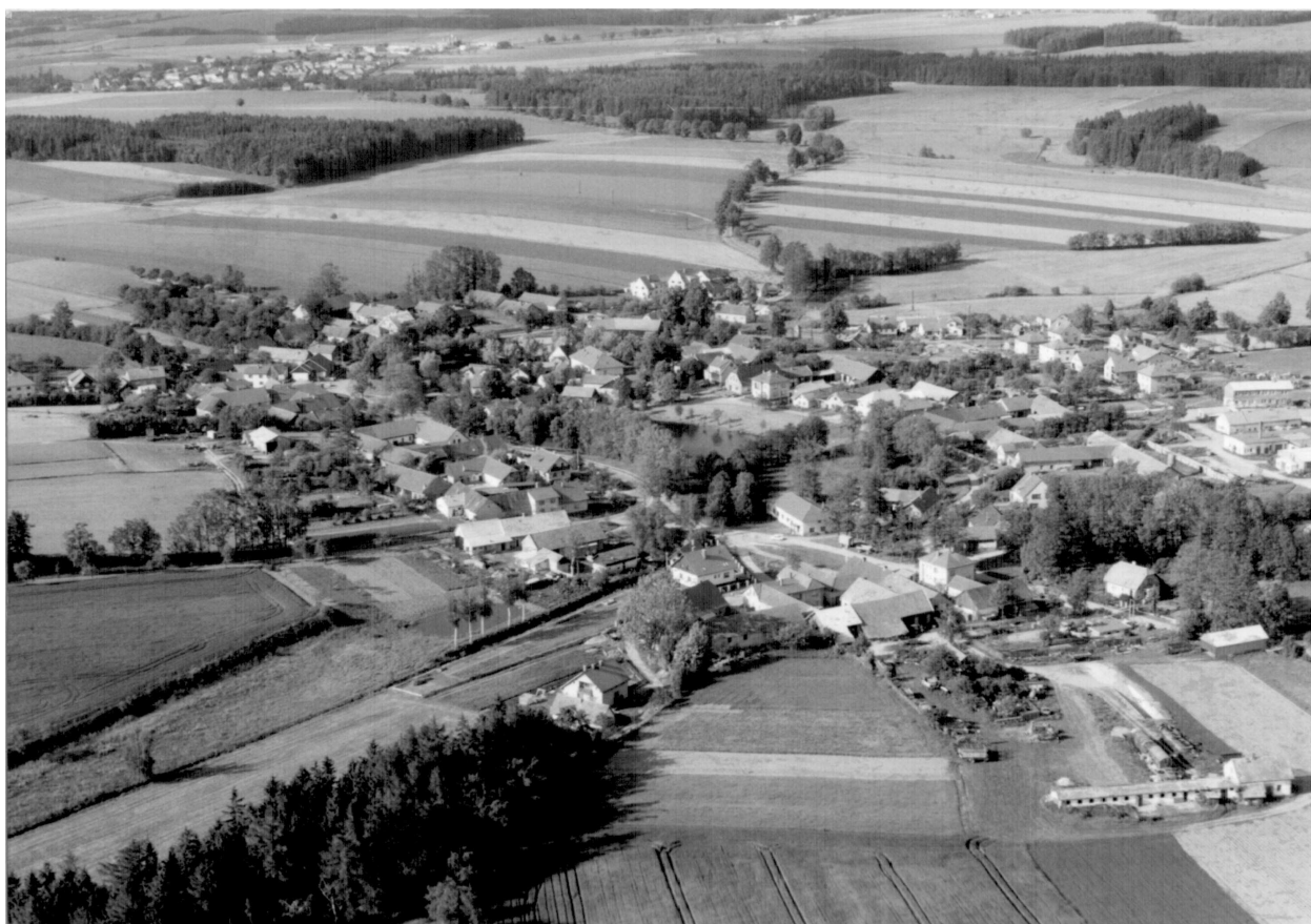
Letecký snímek Poděšína (foto skenováno novým zařízením)