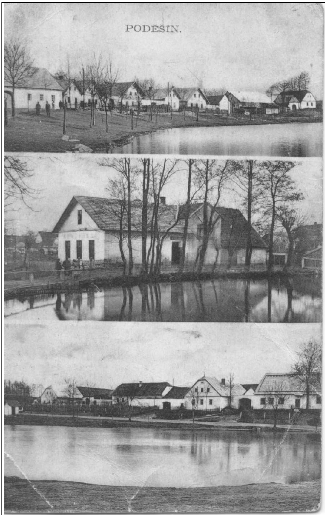
Poděšín před asi 60 lety.